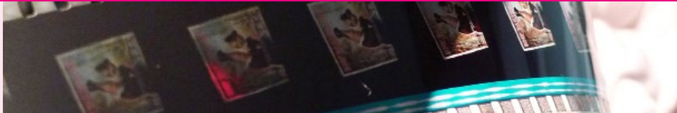
DR Cinémathèque de Nice

Depuis sa création en 1976, la Cinémathèque de Nice a pour mission principale la conservation et la valorisation du patrimoine cinématographique . Elle est membre de la Fédération Internationale des Archives du Film (F.I.A.F.) et de la Fédération des Cinémathèques et Archives de Films de France (F.C.A.F.F.).