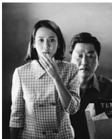
© DR Barunson E&M, CJ Entertainment

LUNDI 22 JUIN : 19H30 / DIMANCHE 28 JUIN : 16H30