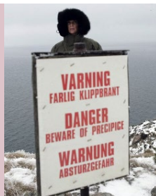
© DR Zentropa Produktion, Merita Film, Slot Machine