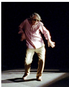
© DR O Som e a Fúria

MARDI 30 JUIN : 14H / VENDREDI 3 JUILLET : 20H