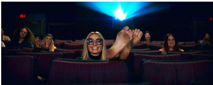
Once Upon a Time... in Hollywood

Une programmation riche et éclectique, une réglementation sanitaire optimale et la joie de retrouver les meilleures conditions techniques pour découvrir un film, font de cette réouverture une véritable fête du cinéma... ensemble !